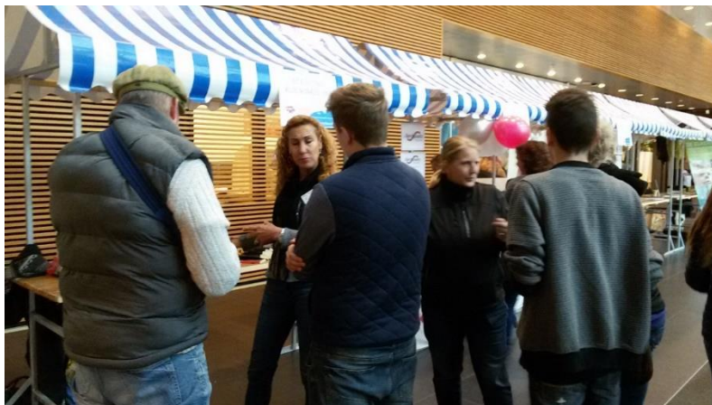
Een indruk van de druk bezochte stagemarkt

Tenslotte hebben we nog de mogelijkheid van een veiling, als iets bijzonders wordt ingebracht. Dit wel pas nadat deze optie met de inbrenger is overlegd. Het betreffende artikel wordt dan voor CrOssjes geveild.